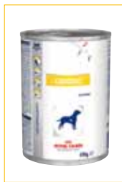
Blikvoeding van 420g