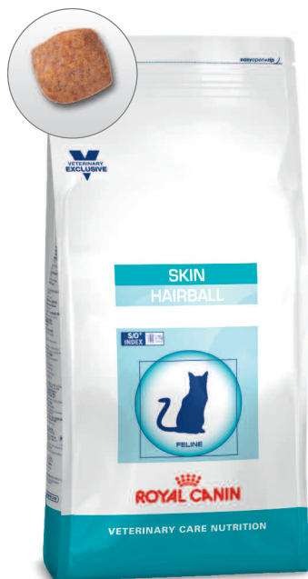
Sack: 400 g 1 , 1,5 kg und 3,5 kg