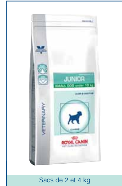
Sacs de 2 et 4 kg

***L.I.P. (Low Indigestible Protein) : Protéine sélectionnée pour sa très haute assimilation