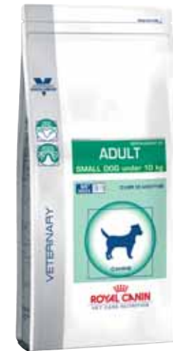
Sacs de 2 - 4 et 8 kg

***L.I.P. (Low Indigestible Protein) : Protéine sélectionnée pour sa très haute assimilation