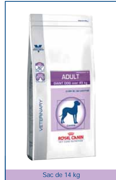
Sac de 14 kg

***L.I.P. (Low Indigestible Protein) : Protéine sélectionnée pour sa très haute assimilation