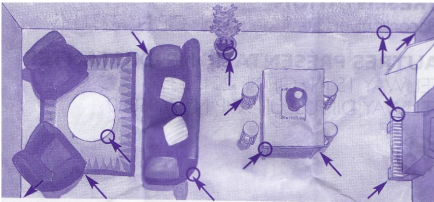
Exemple de pièce et de schéma de pulvérisations

Si plusieurs chats, réaliser 2 à 3 pulvérisations par jour.