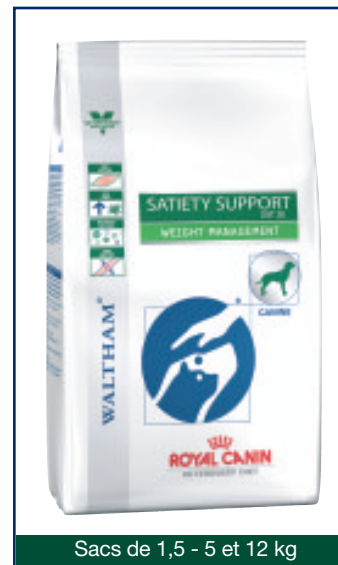
Sacs de 1,5 - 5 et 12 kg