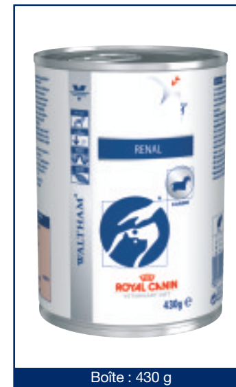
Boîte : 430 g