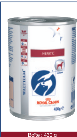
Boîte : 430 g