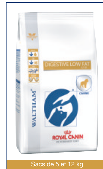
Sacs de 5 et 12 kg