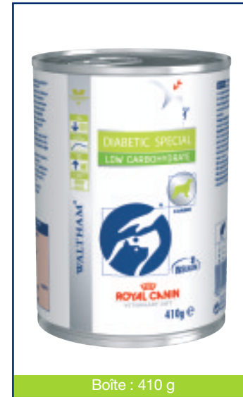
Boîte : 410 g