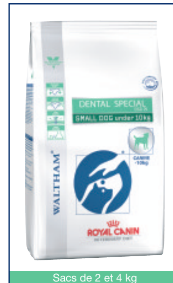
Sacs de 2 et 4 kg