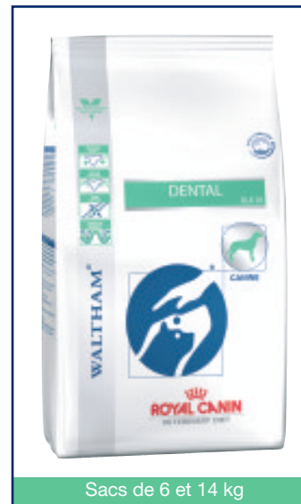
Sacs de 6 et 14 kg